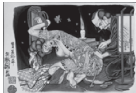
井上 孝紘 浮世絵“女師彫物図”