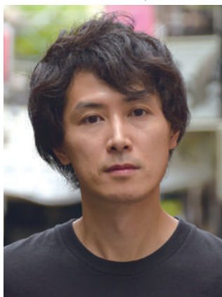
栗原 康 (政治学者、作家)