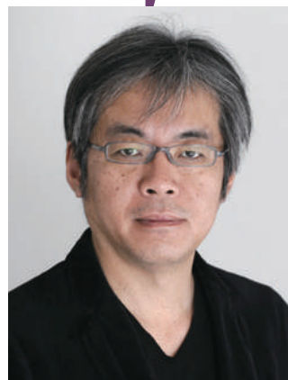
司会・進行 青木 理 (ジャーナリスト)